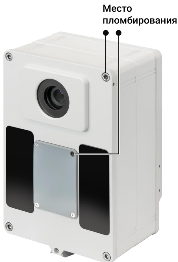
Рисунок 2 – Общий вид и места пломбирования ИМ комплекса (модификация 2)